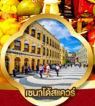
เซนาโตสแควร์