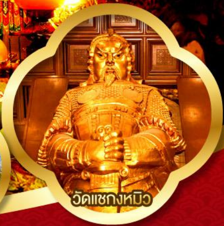
วัดเซกหมิว