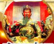
นมัสการเทพเจ้ากวนอู ขออำนาจและบารมี