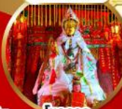
โชคลาภ และความมั่งคั่ง