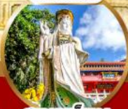
สุขภาพแข็งแรง และอายุยืน