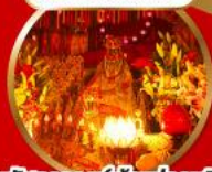
นมัสการองค์เจ้าแม่กวนอิม ที่มีอายุกว่า 600 ปี