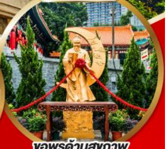
ขอพรด้านสุขภาพ