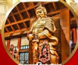
ขอพรโชคลาภ การเงินและธุรกิจ