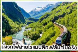
นั่งรถไฟสายโรเมนติก ฟลัมโบเดคริส