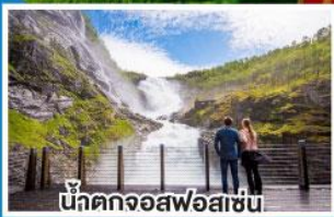
น้ำตกจอสฟอสเซ่น