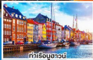
ท่าเรือฮาวน์