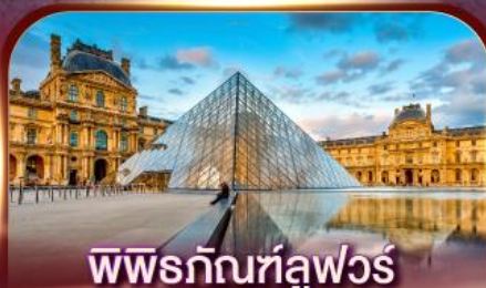
พิพิธภัณฑ์ลูฟวร์