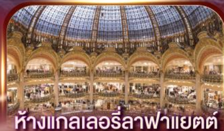
ห้างแกลลอรี่ลาฟาแยตต์