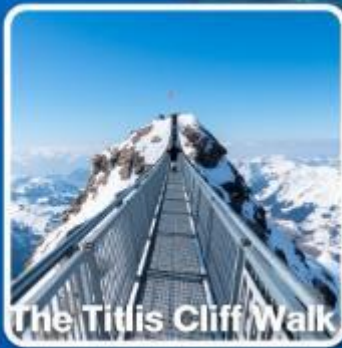
The Titlis Cliff Walk