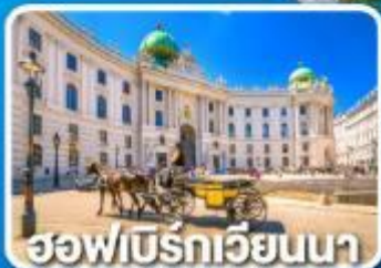
ฮอฟเบิร์กเวียนนา