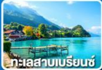
ทะเลสาบเบรียนซ์