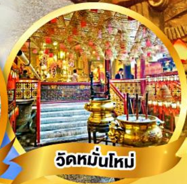
วัดหมื่นใหม่