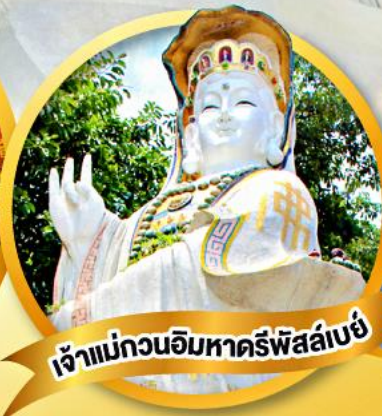
เจ้าแม่กวนอิมหาดรีฟส์ลีย์