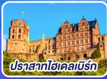
ปราสาทไฮเดลเบิร์ก