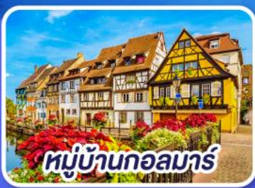
หมู่บ้านกอลมาร์