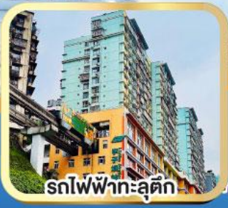
รถไฟฟ้าทะลุคิง