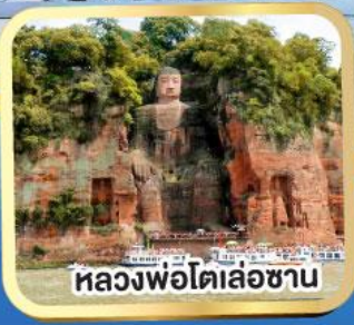
หลวงพ่อโตเล่อซาน