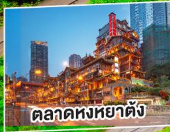
ตลาดหงหยาดัง