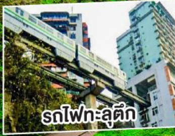
รถไฟทะลู่ตัก