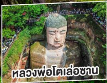
หลวงพ่อดิล่อซาน