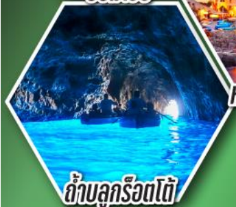
ถ้ำลูกรีดใต้