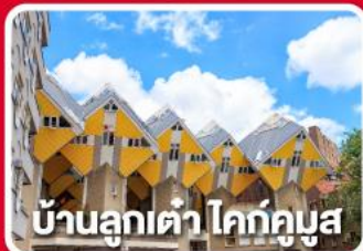
บ้านลูกเต่า โคกคูนูส