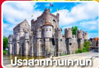
ปราสาทท่านเคานท์