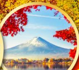
ทะเลสาบ คาวาคูจิโกะ