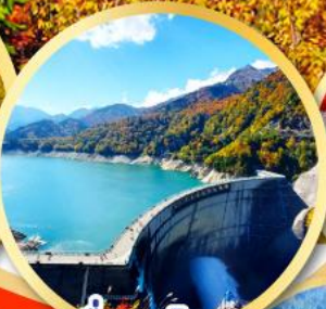
เขื่อนคุโรเบะ