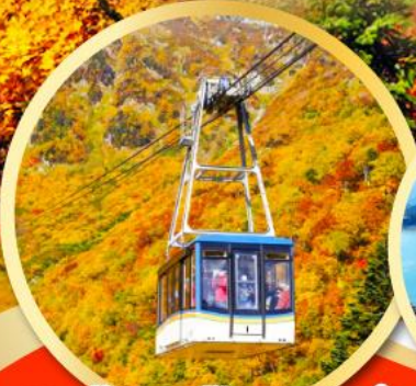
กระเช้าลอยฟ้าทาเทยาม่า