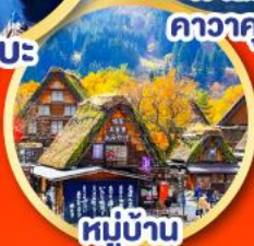
หมู่บ้าน ชิราคาวาโกะ

นั่งกระเช้าลอยฟ้า ชมใบไม้เปลี่ยนสีแบบพาโนรามา