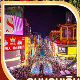
ถนนคนเดิน หวงซิงลู่