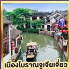
เมืองโบราณจูเจียเจี้ยว