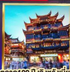
ตลาด 100 ปี เติ้งหวิงเมี่ยว