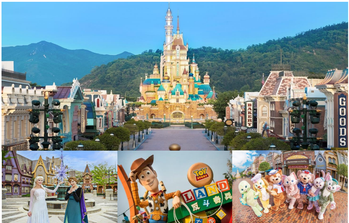
Option: Disneyland (ไม่รวมค่าเดินทาง)