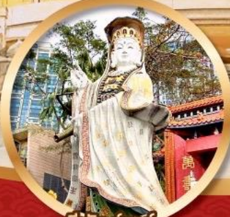
รีพัลส์เบย์