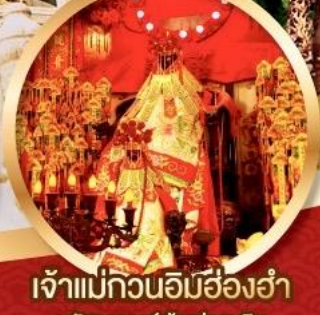
เจ้าแม่กวนอิมสี่องค์

นมัสการองค์เจ้าแม่กวนอิม อายุกว่า 600 ปี