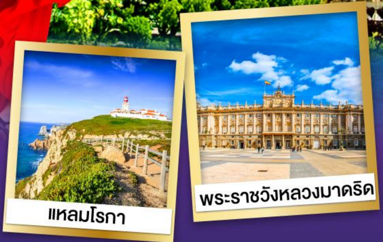
แหลมโรกา