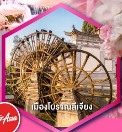
เมืองโบราณลีเจียง