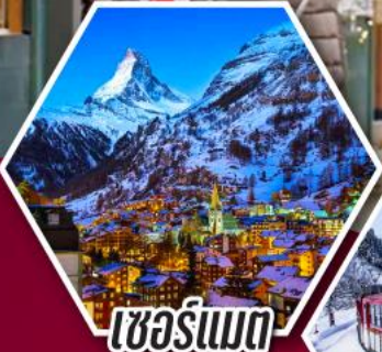
เซอร์แมท