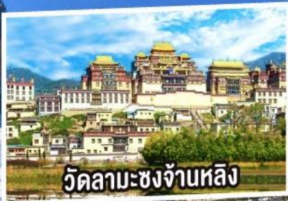
วัดลามะชงจ้านหลิง