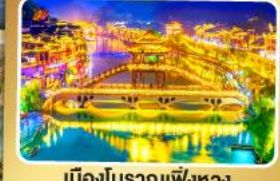
เมืองโบราณเฟิ่งหวง