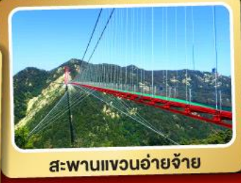
สะพานแขวนอ้ายจ้าย