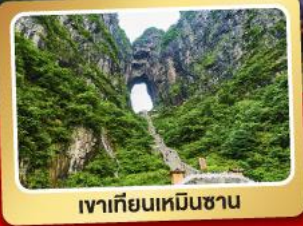
เวาเทียนเหมินซาน