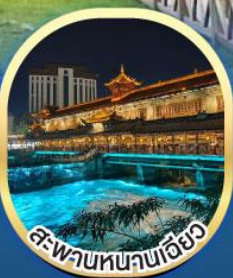
สะพานหนานเฉียว