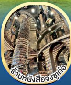
ร้านหนังสือจงซูเก้อ