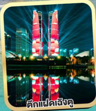
ตึกแฝดเจิงตู