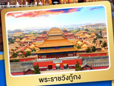
พระราชวังกู้กง