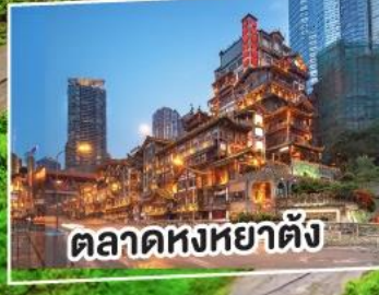
ตลาดหงหยาดัง