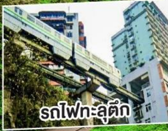
รถไฟเหาะตุ๊ก