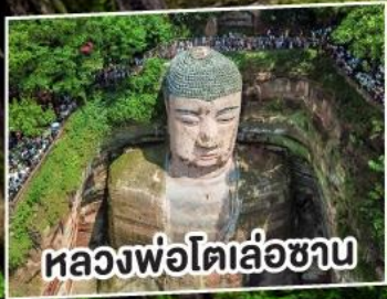
หลวงพ่อดิล่อซาน