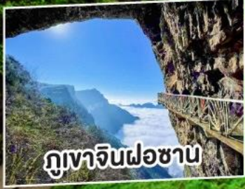
ภูเขาจินฝอซาน