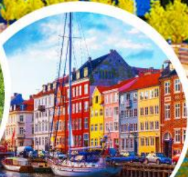
ท่าเรืออ่าววัน.โตป็นเฮกเกน