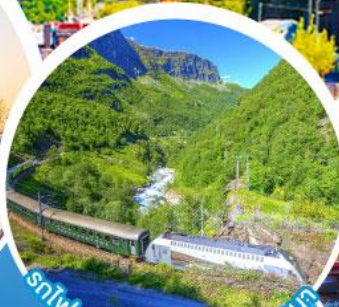
รถไฟสายโรแมนติกฟลัมสบานา