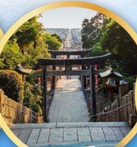
ศาลเจ้ามียาจิดากะ