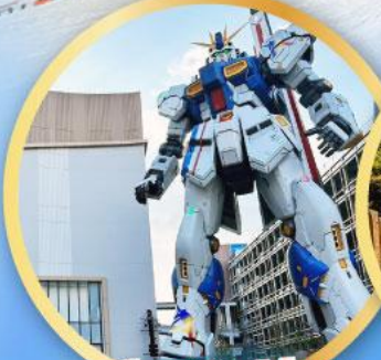
กันดั้ม ปาร์ค ฟุกุโอกะ

เดินทาง 09-13, 16-20, 23 -27 ม.ค.68 06-10,13-17, 20-24 ก.พ. 68 07-10 มี.ค. 68