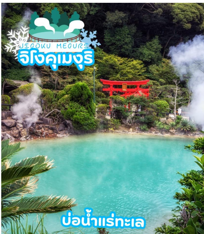
บ่อน้ำแร่ทะเล

ได้เวลาอันสมควรนำท่านเดินทางสู่ เมืองเบปปุ (Beppu) เมืองในจังหวัดโออิตะ (OITA) ตั้งอยู่บนชายฝั่งทะเลตะวันออกของเกาะคิวชู ประเทศญี่ปุ่น เป็นเมืองท่องเที่ยวแช่น้ำพุร้อนยอดนิยมของญี่ปุ่น จัดเป็นเมืองที่มีรีสอร์ทน้ำแร่มากที่สุด นักท่องเที่ยวนิยมมาแช่ออนเซนหรืออบทรายร้อนริมทะเลที่เมืองนี้