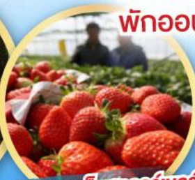
กิจกรรมเก็บสตอว์เบอร์รี่