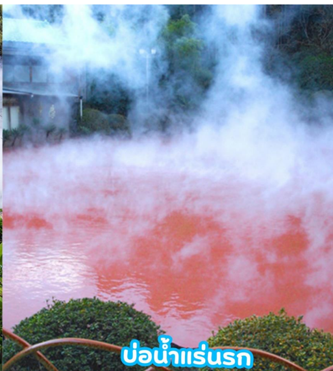
บ่อน้ำแร่รอก