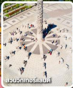
สวนวิกเทอร์แลนด์