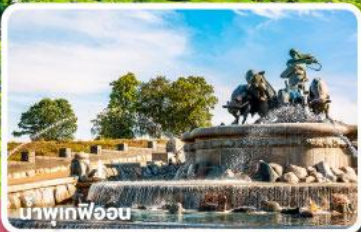
นาฬิกาฟ็อน