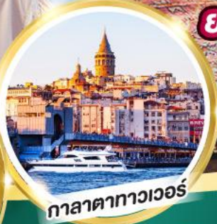
กาลาตาทาวเวอร์