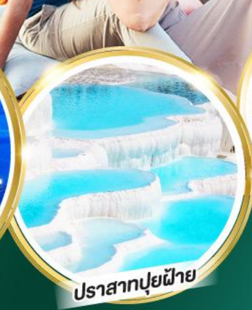
ปราสาทปูยฝ้าย