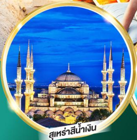
สุเหร่าสีน้ำเงิน

ฟรี!! พวงกุญแจ Evil Eye ชาเอ็ปเปิล, โอคครีมมาโก