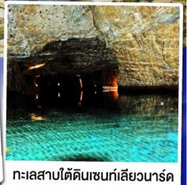
ทะเลสาบไ้ตตินเซนท์สิยวนาร์ด

ล่องเรือชมทะเลสาบไ้ตตินเซนท์สิยวนาร์ด ทะเลสาบไ้ตตินลึกลับ สุดUnseenแห่งสวิตเซอร์แลนด์