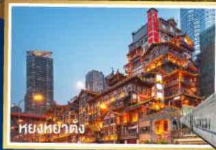
หยงหย่าต้ง