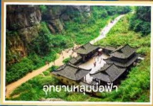
อุทยานหลุมบ่อฟ้า