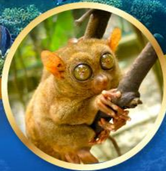
สิงทาร์เซีย