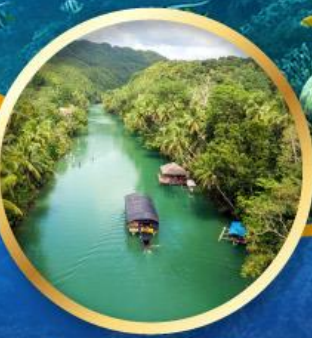
สองเรือแม่น้ำไลบ็อก