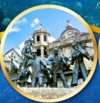
อนุสาวรีย์มรดกแห่งเซบู