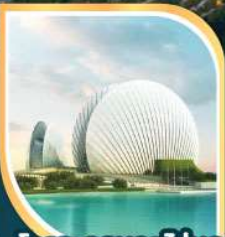
โรงละครหอยโข่มุก