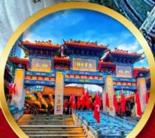
วัดหวังตักเซียน