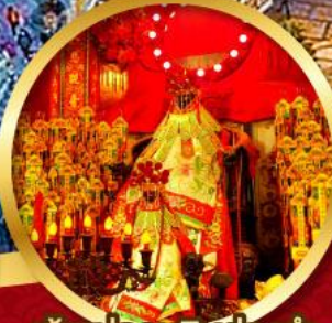
เจ้าแม่กอนอิมฮ้องอำ

นมัสการองค์เจ้าแม่กวนอิม อายุกว่า 600 ปี