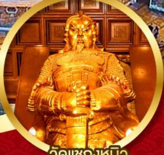
วัดเข่งหีบิว

นมัสการองค์เจ้าแม่กวนอิม อายุกว่า 600 ปี