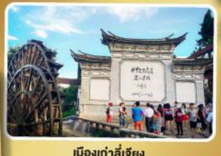
เมืองท่าลี่เจียง