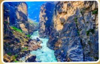
ช่องแคบเลียงโกะโจน