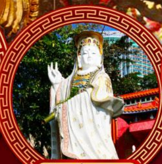
เจ้าแม่กวนอิม รีพัลส์เบย์