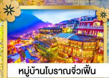
หมู่บ้านโบราณจิวเฟิ่น