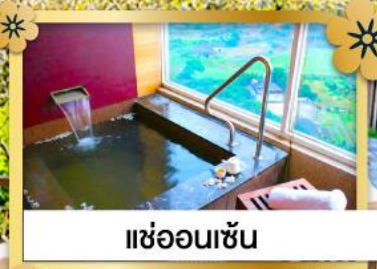
แช่ออนเซ็น