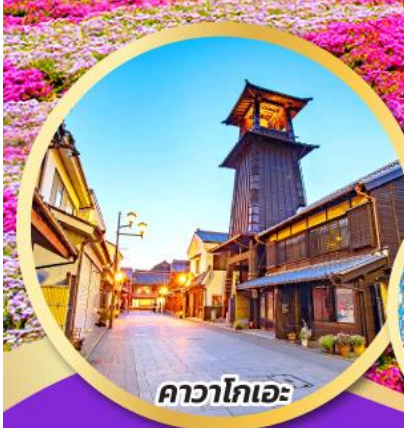
คาวาโกเอะ