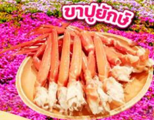
ขาปูยักษ์