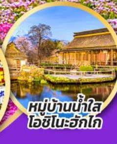
หมู่บ้านน้ำใส โอชิโนะอัทไก