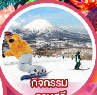
กิจกรรม ลานสกี