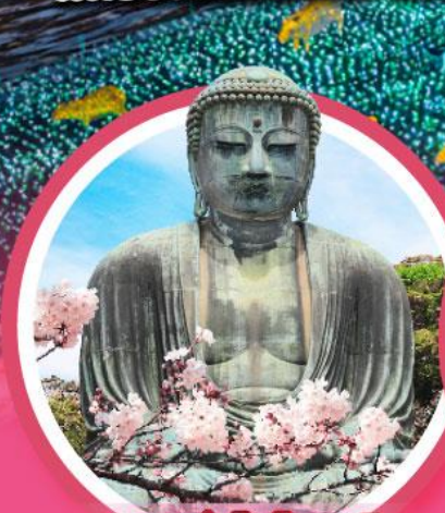
หลวงพ่อดโตโดบุตสึ