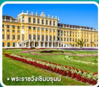
• พระราชวังเฮินบรุนน์