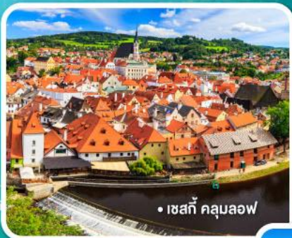
• เซสกี คลุมลอฟ