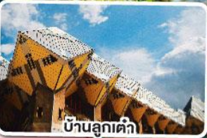
บ้านลูกค้ำ