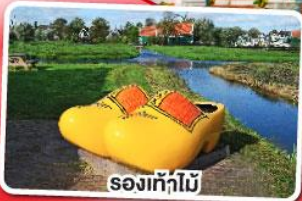
รองเท้าไม้