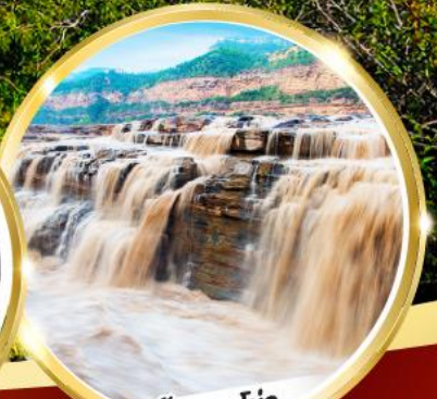
น้ำตกหูโงว