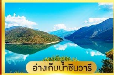
อ่างเก็บน้ำซินวารี