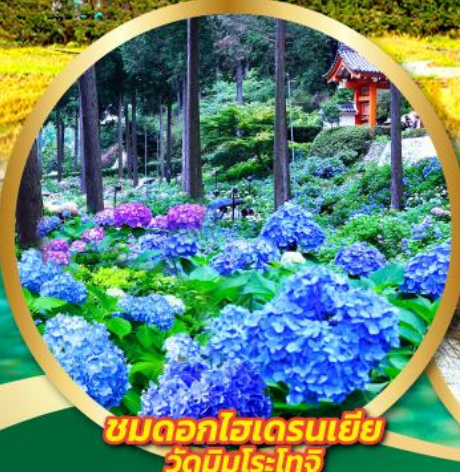
ชมดอกไฮเดรนเยีย วัดมิจูโร-โทจิ