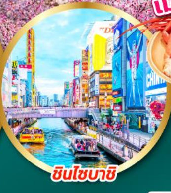
ชินโซบาชิ