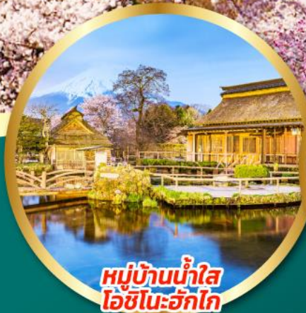
หมู่บ้านน้ำใส โอชิโนะฮักโก