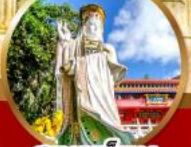
สุขภาพแข็งแรง และอายุยืน