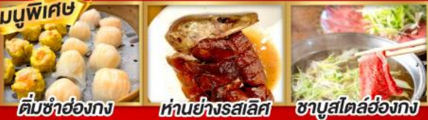
ติ่มซำฮ่องกง