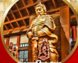
ขอพรโชคลาภ การเงินและธุรกิจ