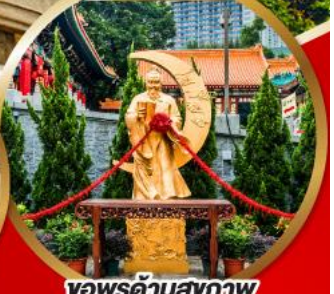
ขอพรด้านสุขภาพ