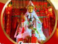
โชคลาภ และความมั่งคั่ง