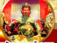
นมัสการเทพเจ้ากวนอู ขออำนาจและบารมี