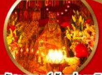
นมัสการองค์เจ้าแม่กวนอิม ที่มีอายุกว่า 600 ปี