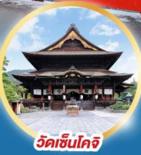
วัดเซ็นโคจิ