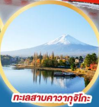
ทะเลสาบคาวากูจิโกะ