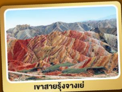
เวาสายรุ้งจางเย่