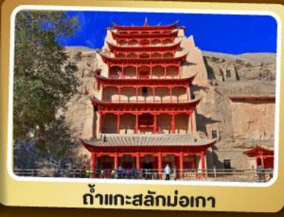
ถ้ำแกะสลักม่อเกา