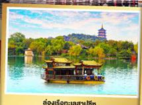
ล่องเรือทะเลสาปซีหู