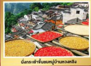
มังกรเจ้าจีนชมหมู่บ้านหวงหลิง