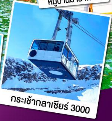
กระเช้ากลาเซียร์ 3000