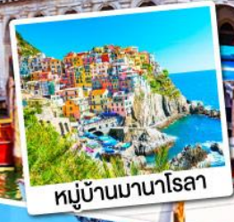
หมู่บ้านมานาโรลา