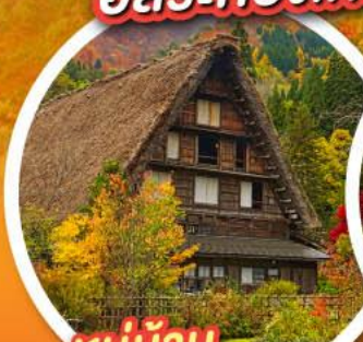
หมู่บ้าน ชิราคาวาโกะ

พักออนเซ็น 2 คืน พักโตเกียว 2 คืน อิสระท่องเที่ยว 1 วันเต็ม