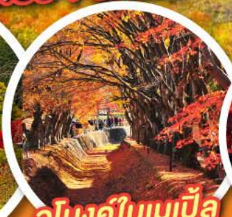
อุโมงค์ใบเมเปิ้ล โมมิจิ โคโร